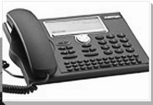
Telefonie - PBX