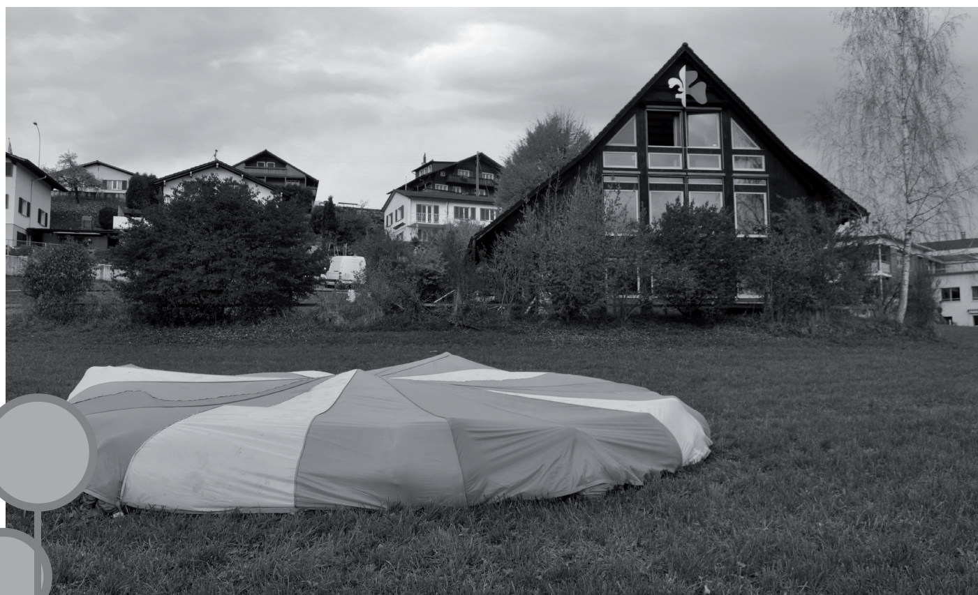
Was sich unter diesem Objekt für lustige Gestalten verbergen, erBLIKT man auf Seite 9.